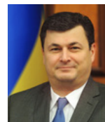
Міністр охорони здоров'я України КВИТАШВІЛІ Олександр від фракції партії «Блок Петра Порошенка»

Реформування дошкільної, середньої, професійно-технічної, позашкільної освіти згідно з європейськими стандартами. Зокрема, підготовка та подання на розгляд Парламенту проектів законів «Про внесення змін до деяких законодавчих актів України щодо професійно-технічної освіти», «Про науку і науково-технічну діяльність», а також «Про освіту».