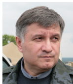
Міністр внутрішніх справ України АВАКОВ Арсен Борисович від фракції Політичної партії «Народний фронт»

Наші середньотермінові цілі в рамках реформ – досягнення наступних результатів в рейтингу Doing Business: реєстрація бізнесу – зараз 76 місце, ціль – 13; реєстрація власності – зараз 59, ціль – 47; забезпечення виконання контрактів – зараз 43, ціль – 31; розв'язання неплатоспроможності – зараз 142, ціль – 75.