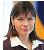
Міністр Кабінету Міністрів України ОНИЩЕНКО Ганна Володимирівна від фракції Політичної партії «Народний фронт»

ке розмежування функцій силового блоку та цивільно-сервісного центру, усунення дублювання повноважень, позбавлення підрозділів органів внутрішніх справ невластивих їм функцій, а також запобігання можливості виникнення корупційних схем. Зокрема, на базі батальйонів особливого призначення та спецпідрозділів МВС буде створено єдиний підрозділ спеціального призначення К.О.Р.Д. У результаті реалізації запланованих заходів у МВС України відбудеться передбачене Коаліційною Угодою скорочення підрозділів боротьби з організованою злочинністю, транспортної та ветеринарної міліції.