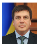
Віце-прем'єр-міністр – Міністр регіонального розвитку, будівництва та ЖКГ України ЗУБКО Геннадій Григорович від фракції партії «Блок Петра Порошенка»

Реформа пам'яткоохоронного законодавства з метою його децентралізації та дерегуляції.