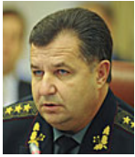
Міністр оборони України ПОЛТОРАК Степан Тимофійович за поданням Президента України

Проведення відкритого публічного конкурсу на посаду директора ДП «Палац спорту». Продовження повернення до державної власності спортивних об'єктів та іншого майна, відчуженого у корупційний спосіб за режиму Януковича.